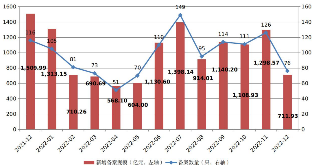
图1 ABS产品每月备案规模及数量变化趋势

2022年12月，企业资产证券化产品共备案确认76只，新增备案规模合计711.93亿元（见图1）。12月新增备案规模环比减少45.18%，同比减少52.85%。