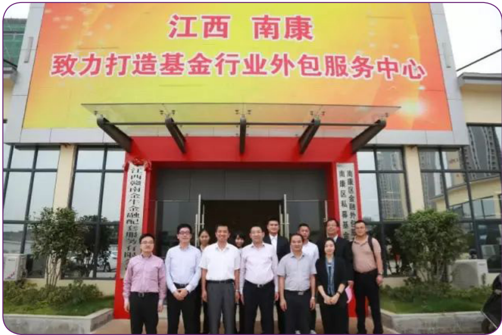
图27 10月17日，中国证券投资基金业协会与江西赣南金牛金融配套服务有限公司合作协议续签仪式在江西赣州举行