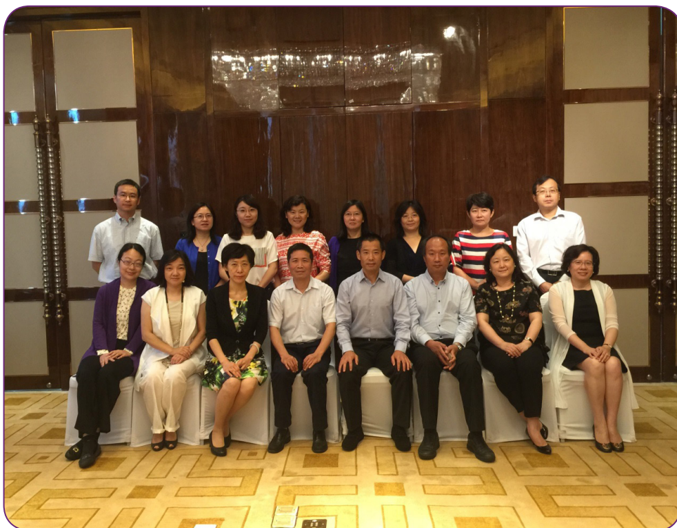
图20 7月29日，中国证券投资基金业协会在哈尔滨召开2016年合规与风险管理委员会第二次会议