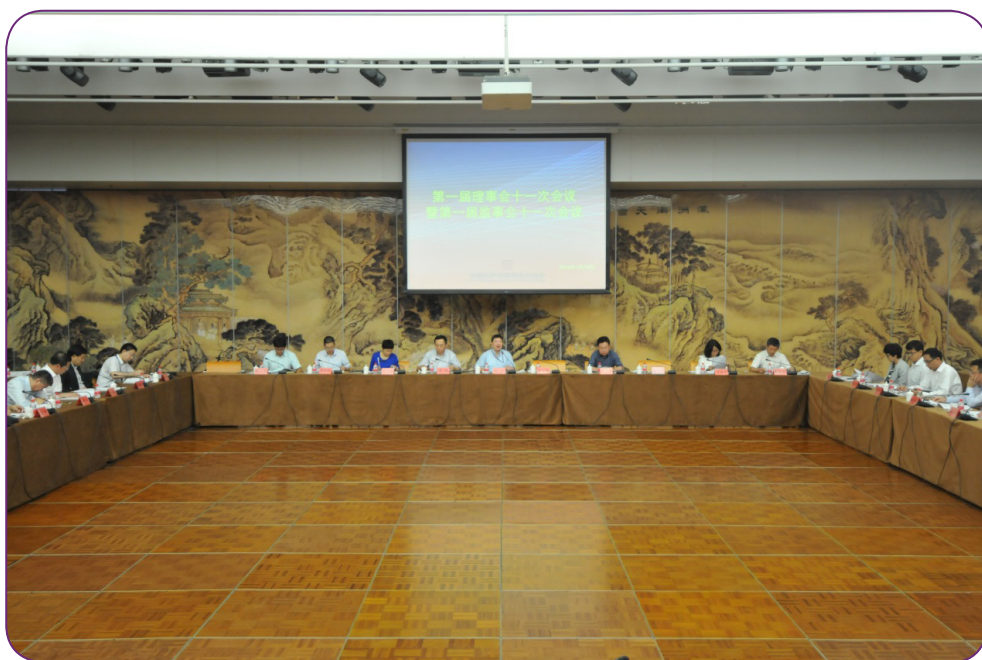
图18 7月18日，中国证券投资基金业协会召开第一届理事会第十一次会议暨第一届监事会第十一次会议