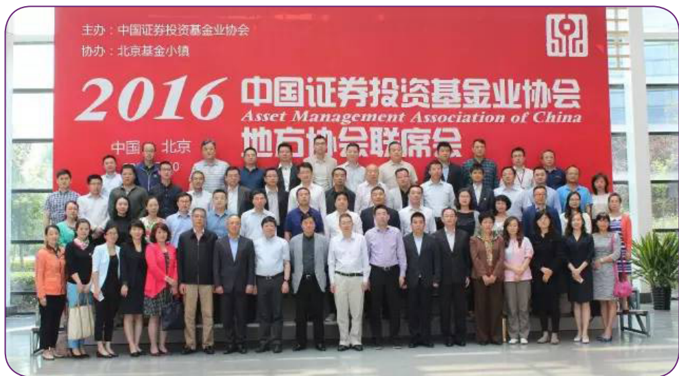
图10 5月20日，中国证券投资基金业协会在北京召开地方协会联席会议