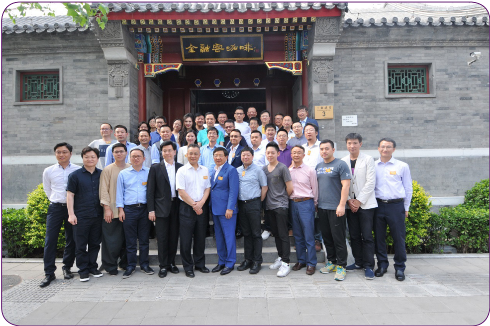
图14 6月16日，中国证券投资基金业协会在北京召开中国天使投资联合会成立仪式暨第一次全体成员大会