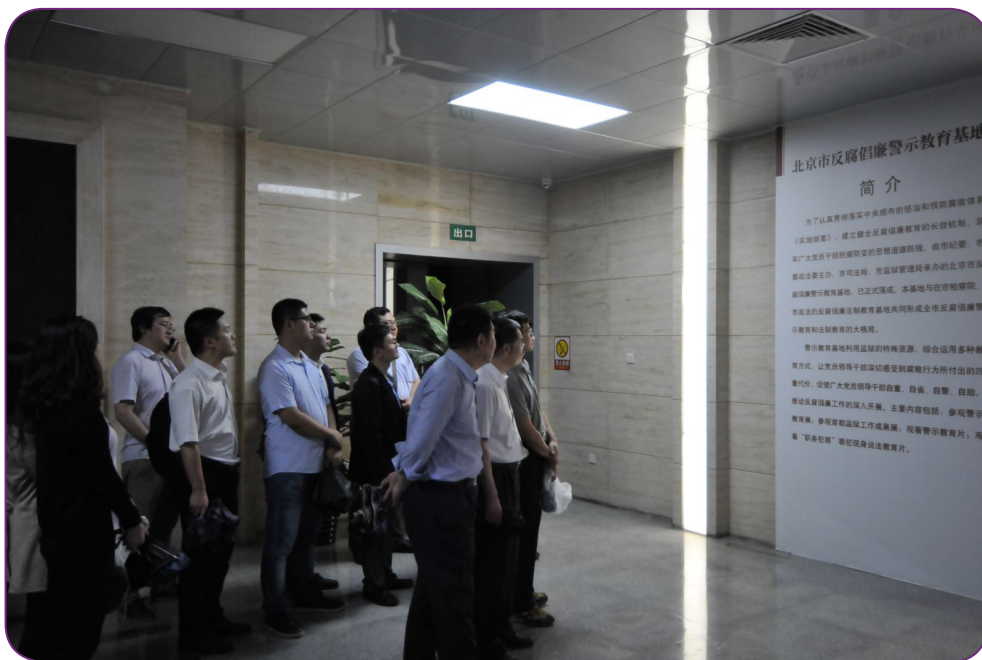
图19 7月20日，中国证券投资基金业协会纪委组织71名员工参观北京市反腐倡廉警示教育基地（北京市监狱）