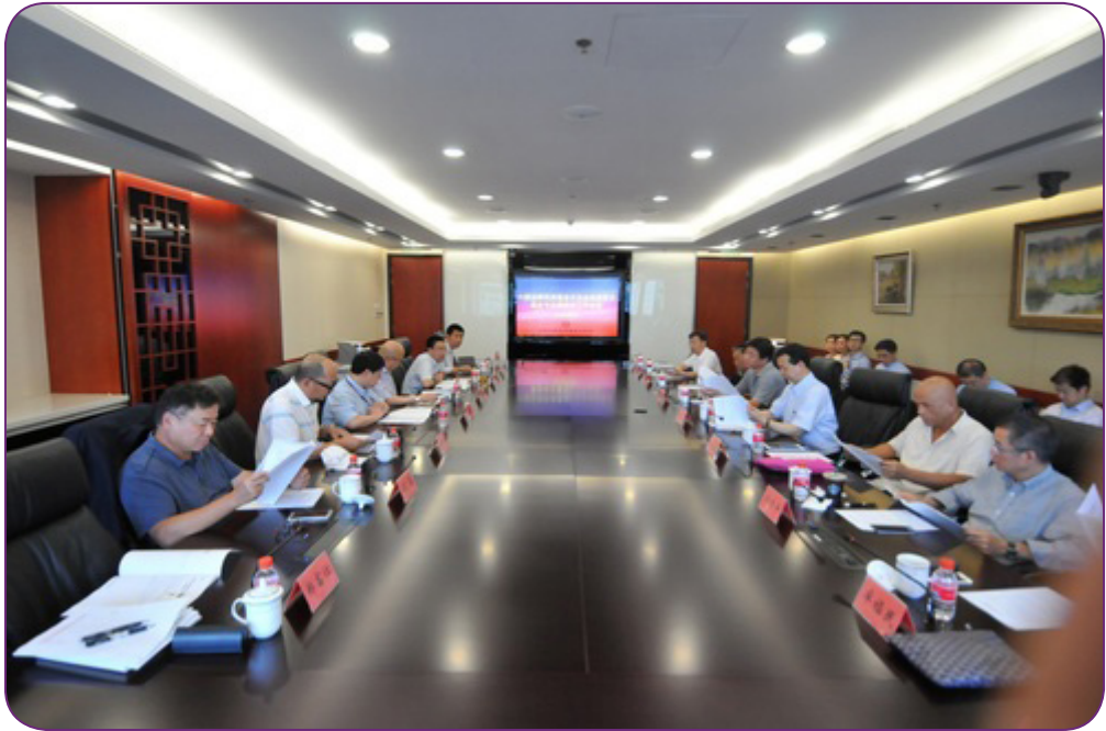
图21 8月2日，中国证券投资基金业协会在北京召开创业投资基金专业委员会工作会议