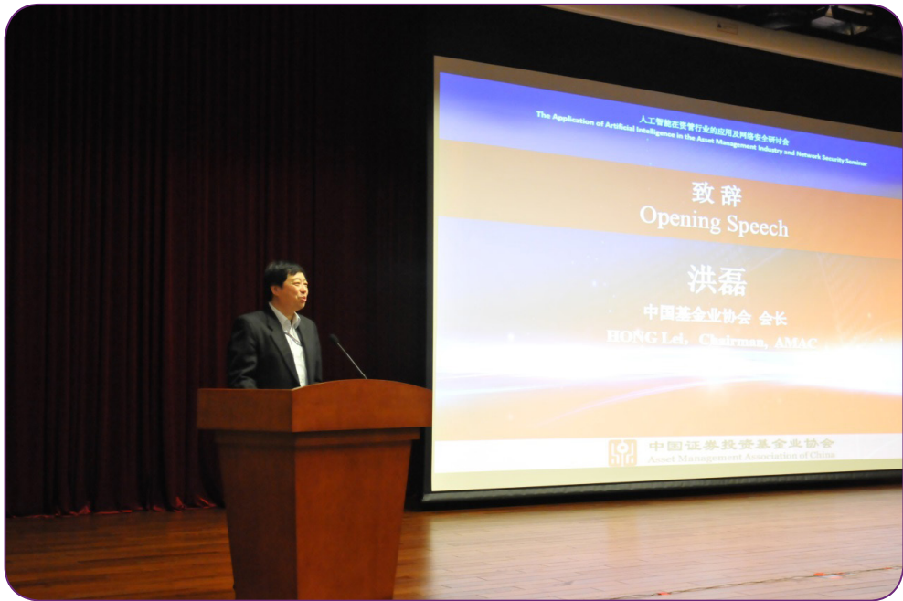
图7 4月8日，中国证券投资基金业协会、中国保险资产管理业协会、另类投资管理协会在北京共同举办“人工智能在资管行业的应用及网络安全研讨会”