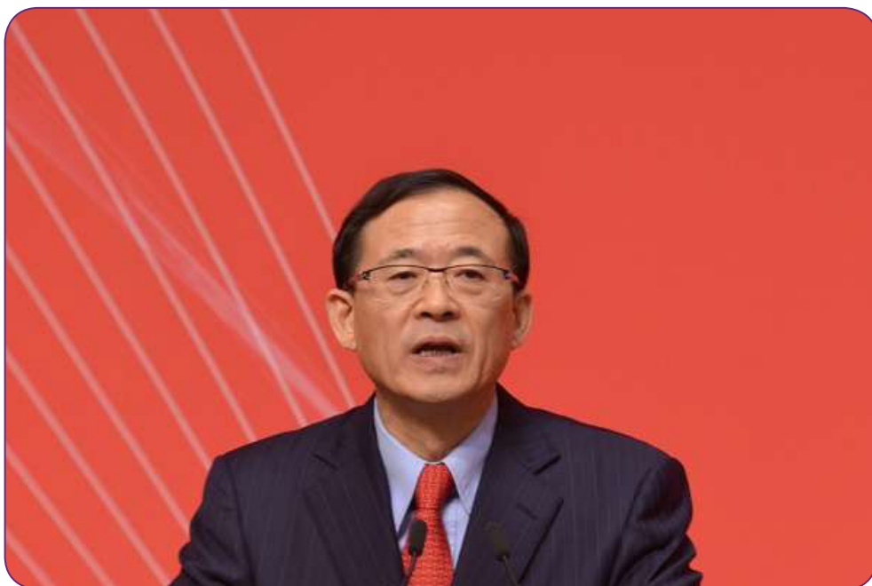
图35 12月3日，中国证券投资基金业协会在北京召开第二届第一次会员代表大会。中国证监会刘士余主席发表致辞，中国证监会李超副主席出席