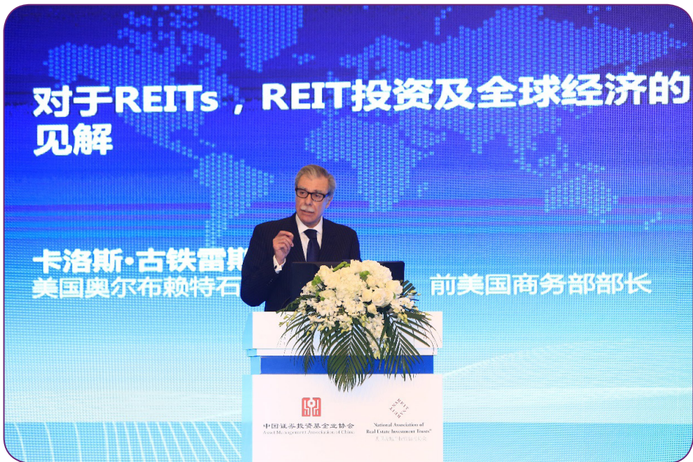
图26 10月17日，中国证券投资基金业协会与全美房地产投资信托协会（NAREIT）合作在北京举办“REIT架构、税收与投资研讨会”，美国前商务部部长卡洛斯·古铁雷斯（Carlos Gutierrez）出席并致辞