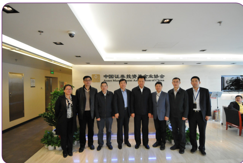
图4 3月16日，天津市副市长、天津自贸区管委会主任阎庆民拜访中国证券投资基金业协会