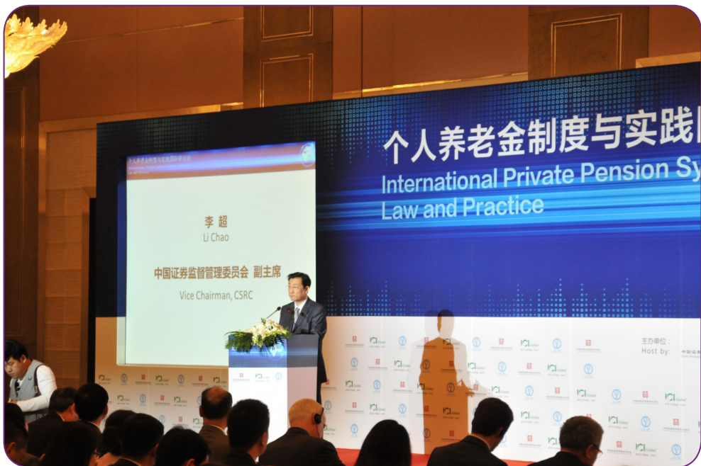
图8 4月22日，中国证券投资基金业协会在北京举办“个人养老金制度与实践国际研讨会”，中国证监会李超副主席在研讨会上致辞