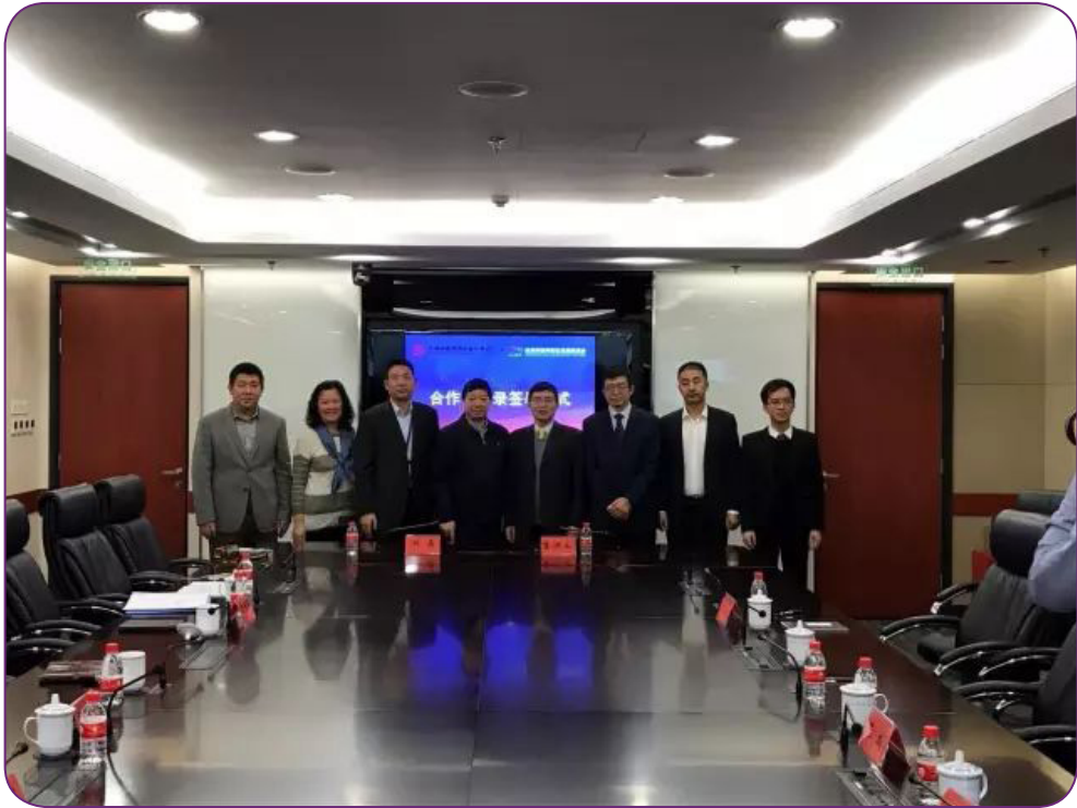
图29 10月24日，中国证券投资基金业协会与珠海市横琴新区管理委员会横琴管委会形成《中国证券投资基金业协会与珠海市横琴新区管委会合作方案》