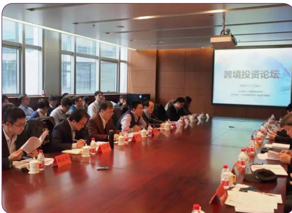
图2 1月20日，中国证券投资基金业协会在北京举办“私享汇一自贸区项下境外资产配置论坛”