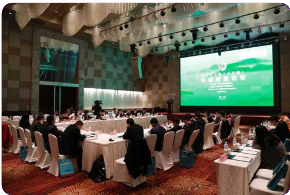
图32 11月8日，中国证券投资基金业协会在徐州举办“私享汇一环保投资论坛”