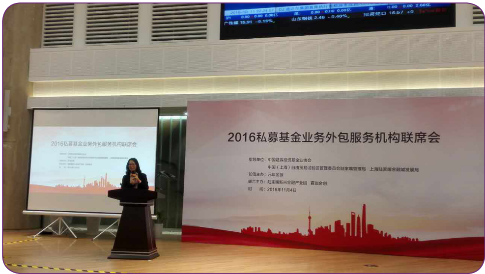
图30 11月4日，中国证券投资基金业协会举办2016年度私募基金业务外包服务机构联席会