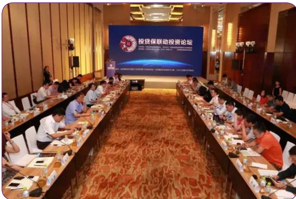
图17 7月13日，中国证券投资基金业协会在青岛举办“私享汇—投贷保联动投资论坛”