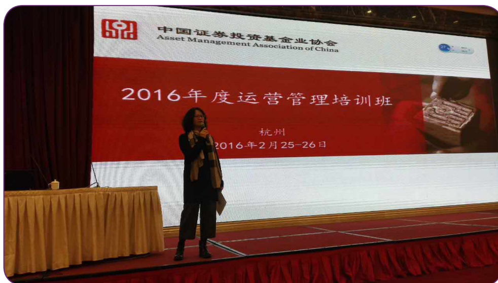
图3 2月25日，中国证券投资基金业协会在杭州举办第一期运营培训班