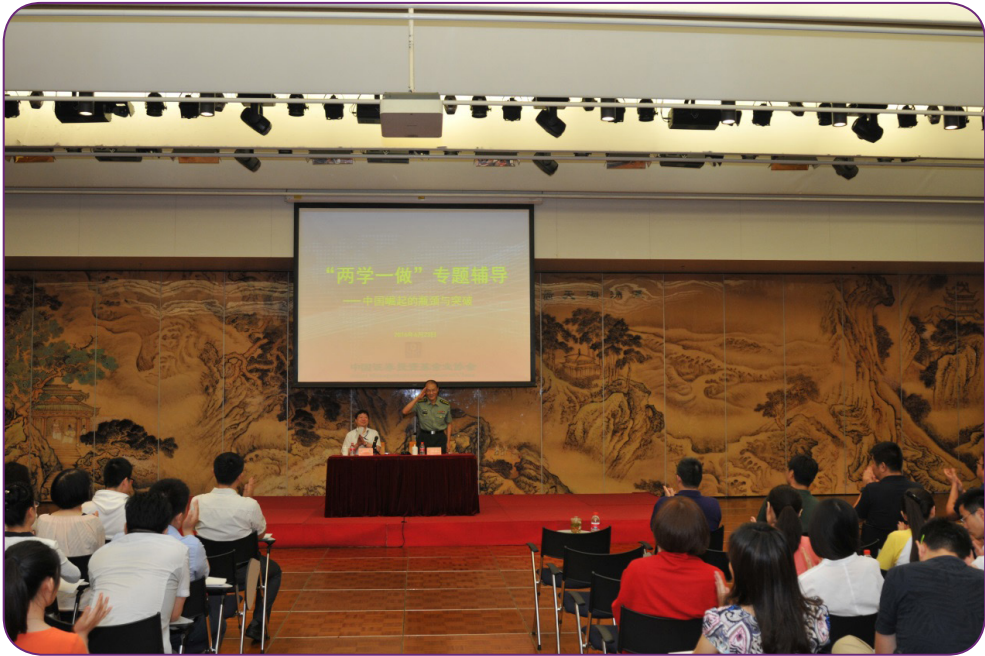
图15 6月23日，中国证券投资基金业协会举办主题为“中国崛起的瓶颈与突破”的“两学一做”专题辅导