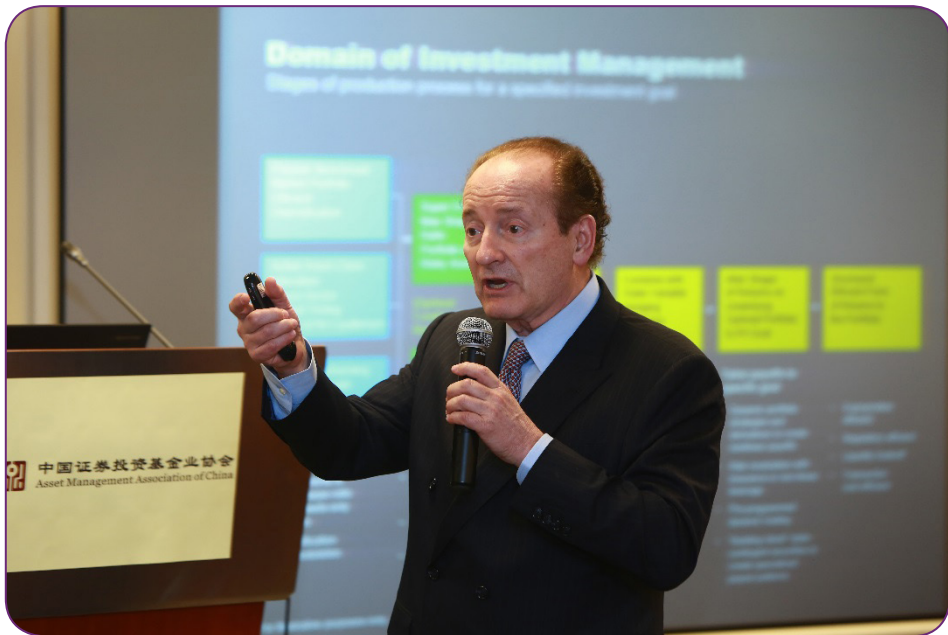
图28 10月21日，1977年诺贝尔经济学奖获得者罗伯特·默顿（Robert C Merton）教授应中国证券投资基金业协会的邀请，在北京为协会会员举行专家讲坛“理解Alpha的来源”