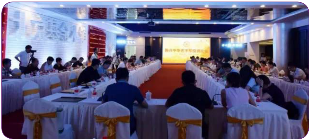
图22 8月3日，中国证券投资基金业协会在北京举办“私享汇—振兴中华老字号投资论坛”