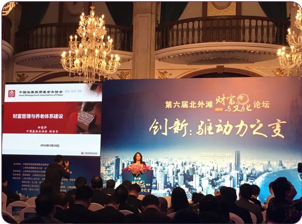
图5 3月24日，中国证券投资基金业协会钟蓉萨副会长在第六届北外滩“财富与文化”论坛发表了“财富管理与养老体系建设”的主题演讲