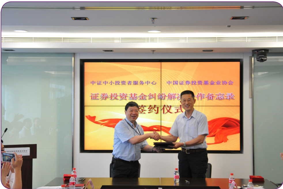
图16 7月5日，中国证券投资基金业协会与中证中小投资者服务中心举办“证券投资基金纠纷解决合作备忘录”签约仪式