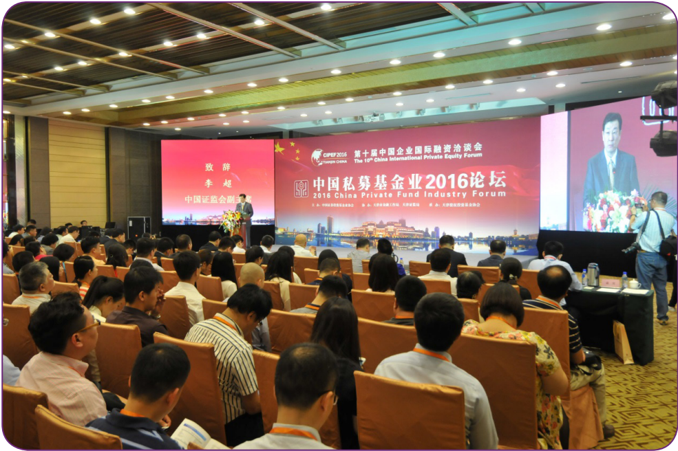
图13 5月30日，中国证券投资基金业协会联合天津金融局、天津证监局、天津股权投资基金协会等单位，在天津第十届中国企业国际融资洽谈会上举办主题为“新思路新产业新业态”的“中国私募基金业2016论坛”，天津市政府阎庆民副市长、中国证监会李超副主席作重要讲话