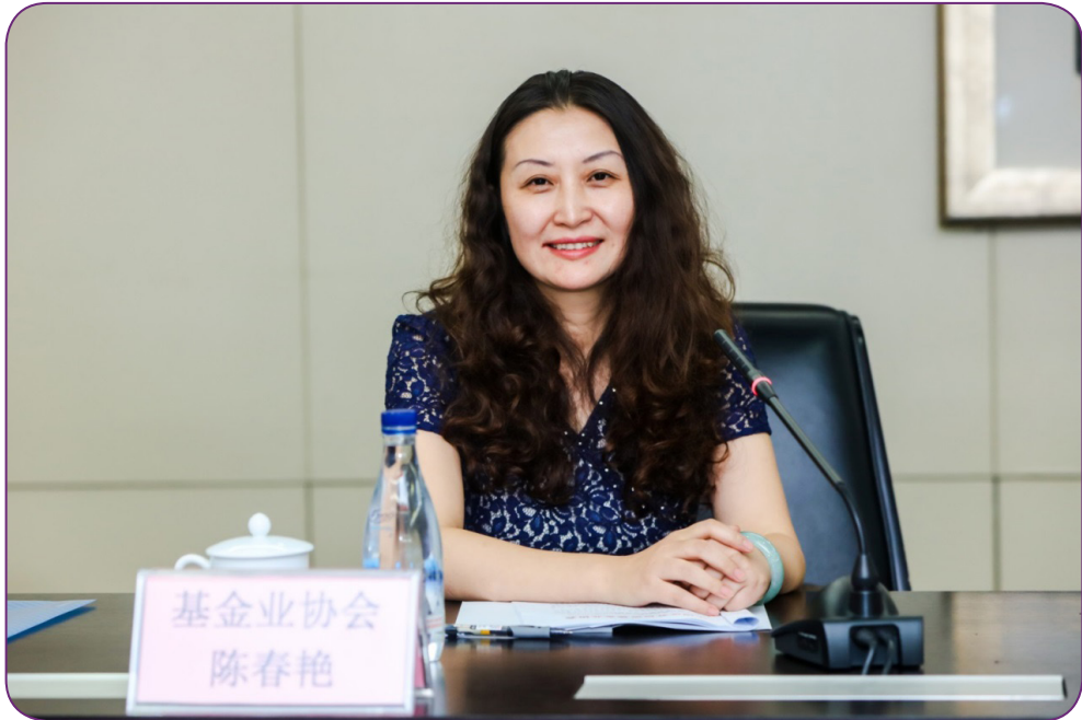
图23 8月12日，中国证券投资基金业协会在青海召开资产管理业务专业委员会工作会议