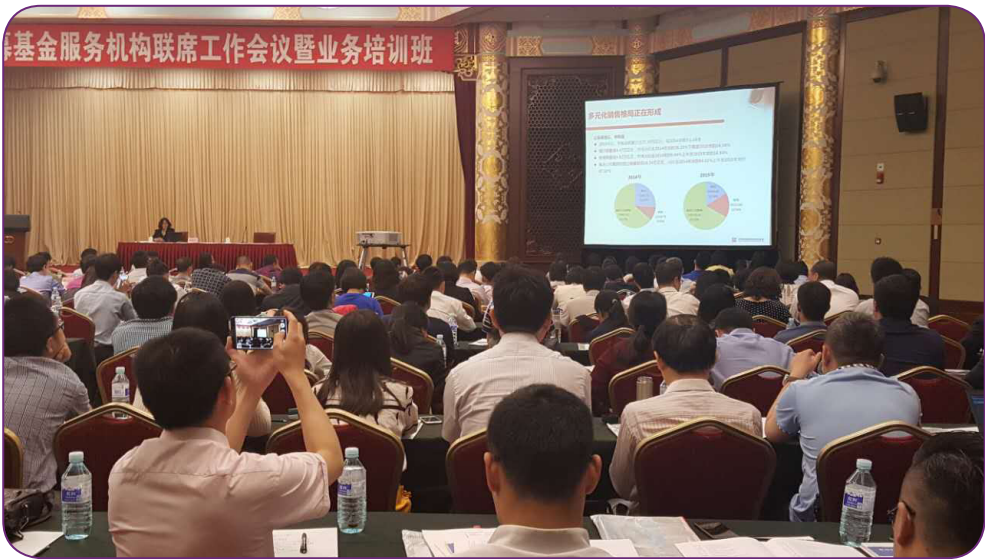
图12 5月26日，中国证券投资基金业协会举办私募基金服务机构联席会议暨业务培训班