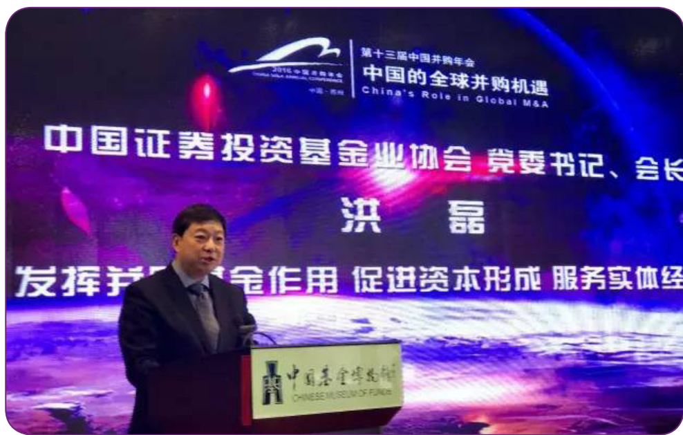
图31 11月5日，中国证券投资基金业协会洪磊会长出席第二届并购基金年会