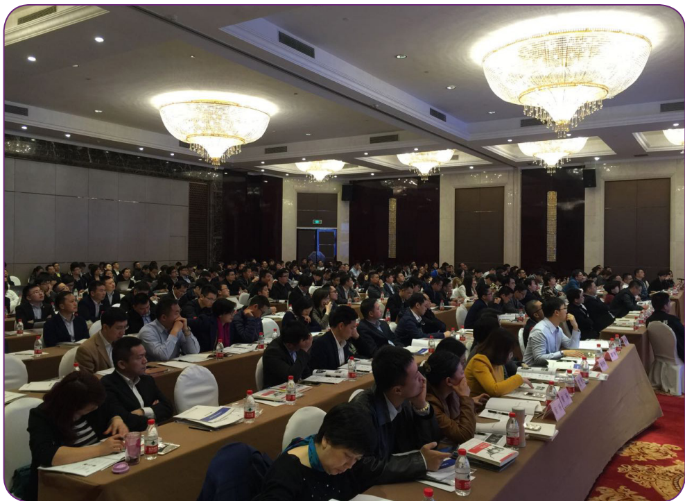
图6 3月30日，中国证券投资基金业协会在杭州召开互联网金融专业委员会工作会议