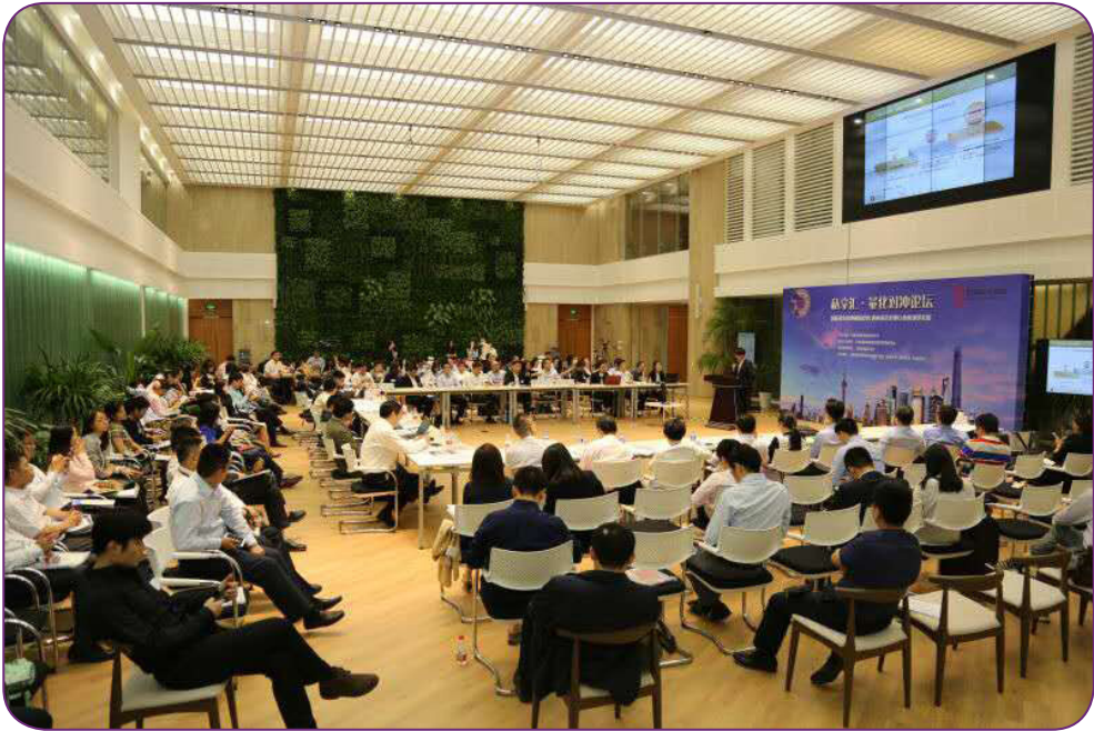
图11 5月25日，中国证券投资基金业协会与陆家嘴管委会联合举办“私享汇—量化对冲论坛”