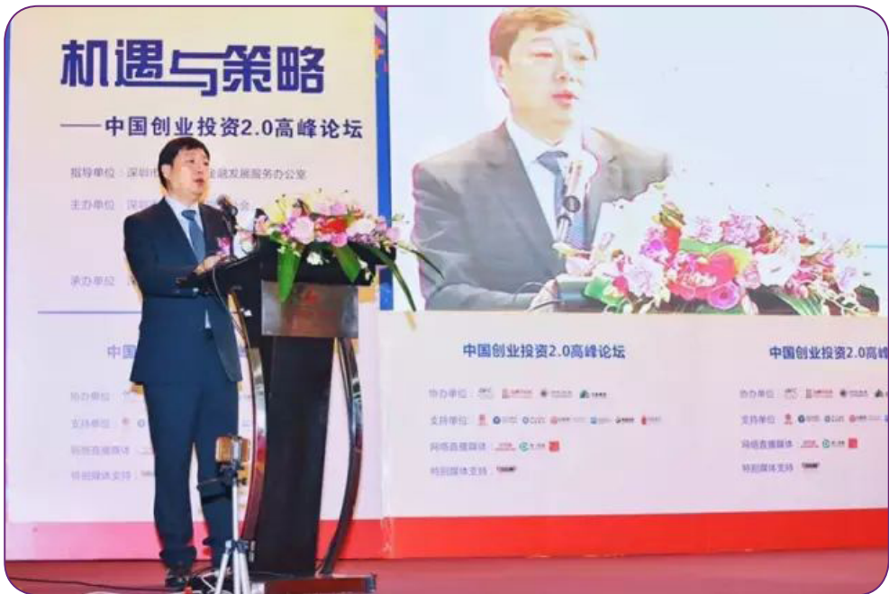
图34 11月18日，中国证券投资基金业协会洪磊会长出席由深圳市创业投资同业公会主办的“第十八届‘高交会’创业投资高峰论坛”并发表主旨演讲