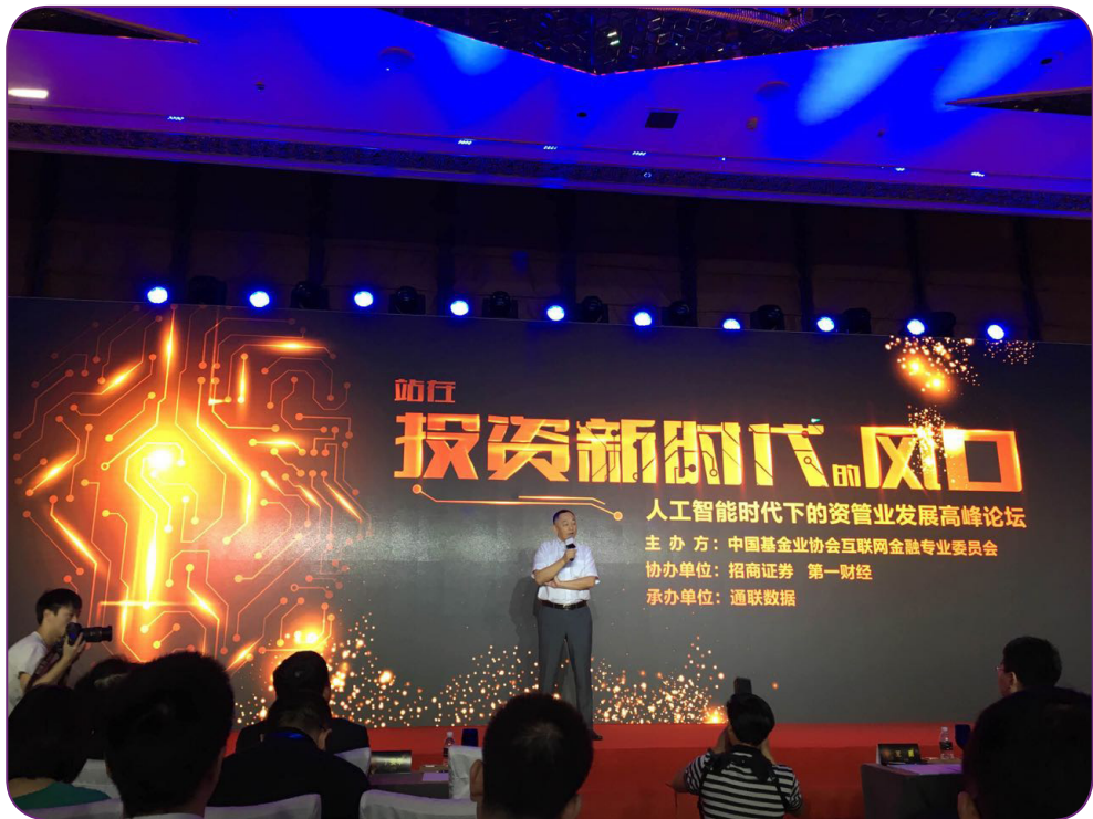
图24 8月31日，中国证券投资基金业协会在上海举办“人工智能时代下的资管业发展”高峰论坛