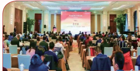
“私募基金与创新发展——资本赋能 驱动创新”主题百人论坛