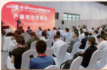
6月26日，与中小企业协会合作举办产融结合对接会