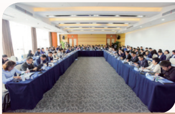
5月8日，与元禾控股、东沙湖基金小镇合作，举办“人工智能+”主题资本与项目、GP-LP的产融结合对接会。