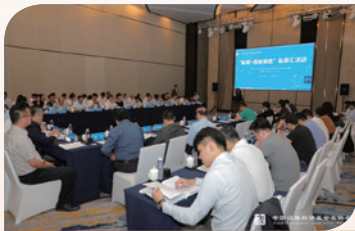
6月12日，在安徽合肥经济技术开发区，举办“私募+智能制造”私享汇活动