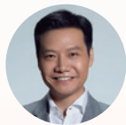
雷军 联席主席 顺为资本 董事长兼首席执行官