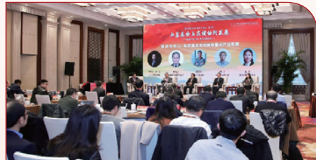
“私募基金与区域协同发展——筑建产业生态 优化资源配置”主题百人论坛