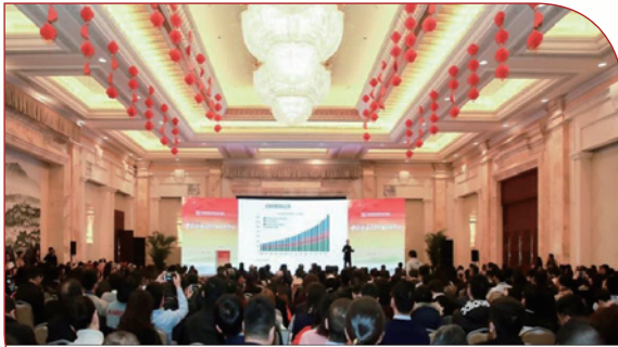
1月11日，中国私募行业高峰论坛在江苏南京成功举办

学家、私募行业专家发表主旨演讲。来自协会私募基金各专委会的委员及其代表，私募基金、银行资管、保险资管、中介服务等相关领域机构代表，新闻媒体代表等近 600 人出席会议。