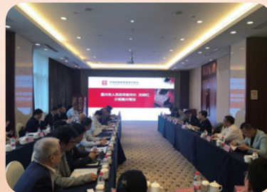
4月27日，与嘉兴市人民政府召开私募基金与区域经济协同发展座谈会