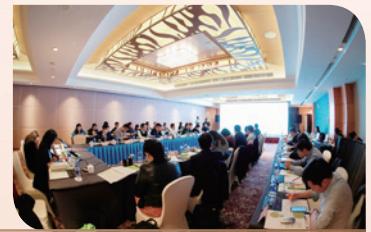
11月27日，在上海举办国家级经开区绿色产业投融资私享汇活动

在私募证券投资基金领域，以与银行理财资金对接、大类资产配置、量化投资等为主题，组织了3期私享汇活动，参与交流行业机构代表达200余人。