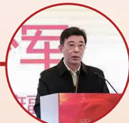
江苏省政府副秘书长 陈少军致辞