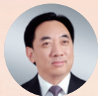
倪泽望 委员 深创投集团董事长