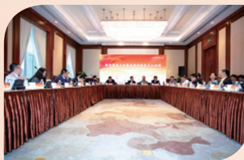
1月11日，在江苏南京成功举办银行资金与私募基金合作主题私享汇活动

在私募证券投资基金领域，以与银行理财资金对接、大类资产配置、量化投资等为主题，组织了3期私享汇活动，参与交流行业机构代表达200余人。