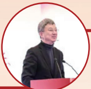
清华大学国家金融 研究院院长、中国 人民银行原副行长、 IMF 原副总裁朱民 发表主旨演讲