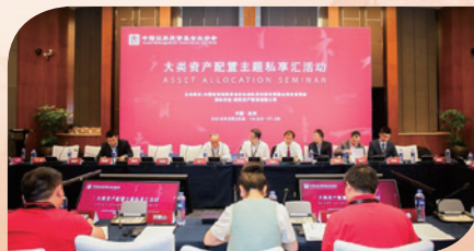
5月25日，在浙江杭州成功举办大类资产配置主题私享汇活动