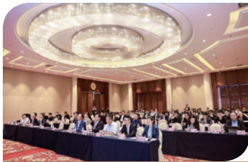
4月28日，与嘉兴市政府联合主办长三角地区科创项目路演私享汇活动

在私募股权投资基金领域，根据小专题、小范围、精准对接原则，按照“行业研讨+项目路演”等模式，先后举办7期私享汇活动，累计参与交流对接的行业机构达452家。