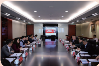
3月19日，组织召开早期投资行业发展与管理座谈会