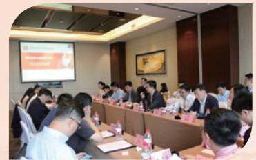
5月17日，在江西南昌成功举办量化投资主题私享汇活动