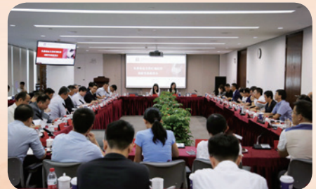
9月24日，与厦门市人民政府召开私募基金支持区域经济创新发展座谈会