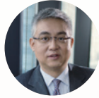
张懿宸 联席主席 中信资本 董事长兼首席执行官