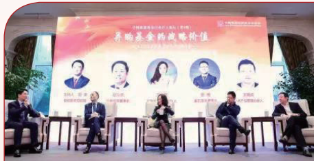
“私募基金与创新发展——资本赋能 驱动创新”主题百人论坛