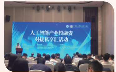
9月25日，与厦门市政府、国科控股联合主办人工智能产业投融资私享汇活动