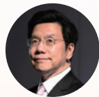
李开复 联席主席 创新工场 董事长兼首席执行官