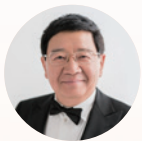
徐小平 主席 真格基金 创始合伙人