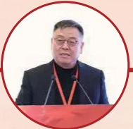
创投基金专委会联席主 席、赛富投资首席合伙 人阎焱发表主旨演讲