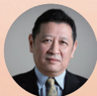
周成跃 委员 财政部 金融司巡视员