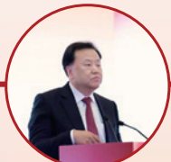
中国证监会副主席 阎庆民致辞