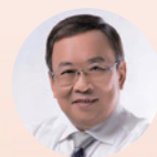
何小锋 委员 北大教授