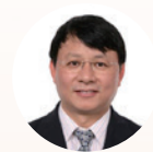
熊晓鸽 委员 IDG资本 董事长