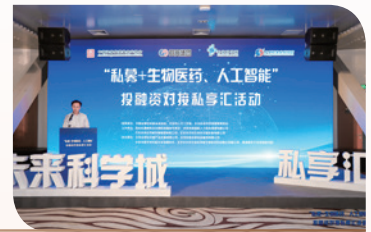
6月27日，与北京未来科学城管委会合作，举办“私募+生物医药、人工智能”投融资对接私享汇活动