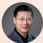
沈南鹏 联席主席 红杉资本 全球执行合伙人