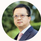
梁信军 委员 复星国际 联合创始人