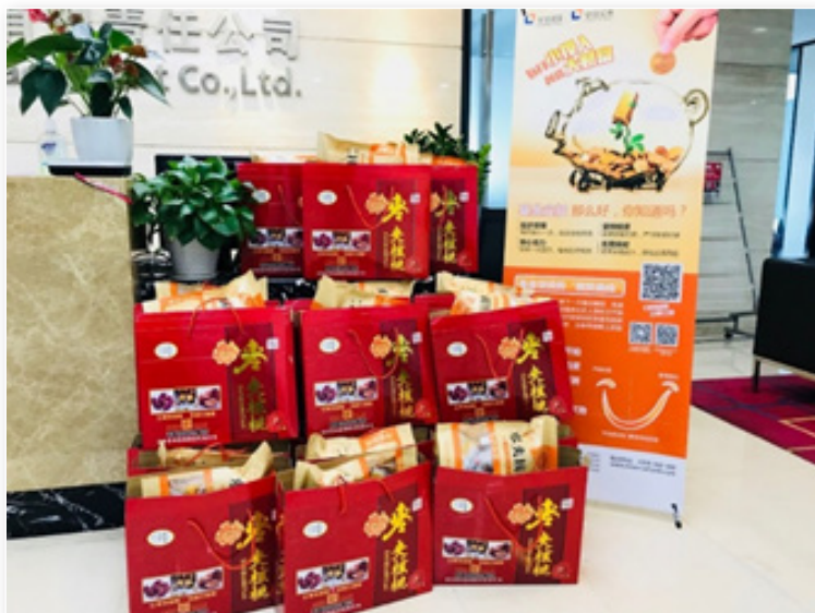
2018年2月, 安信基金购买扶贫农产品。