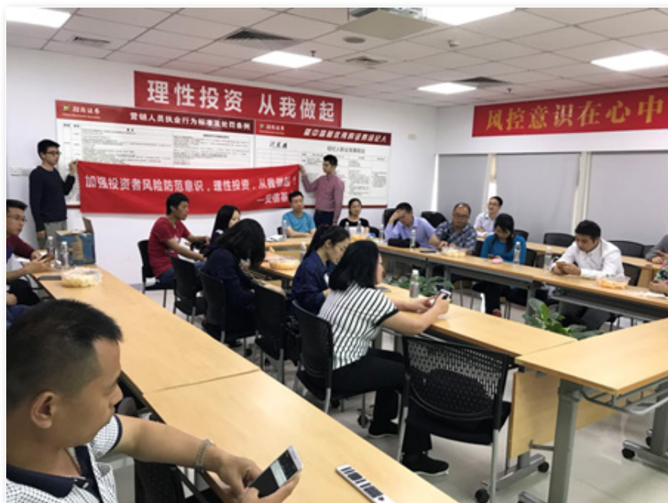
2018年4月, 安信基金在招商证券开展投资者教育培训活动。