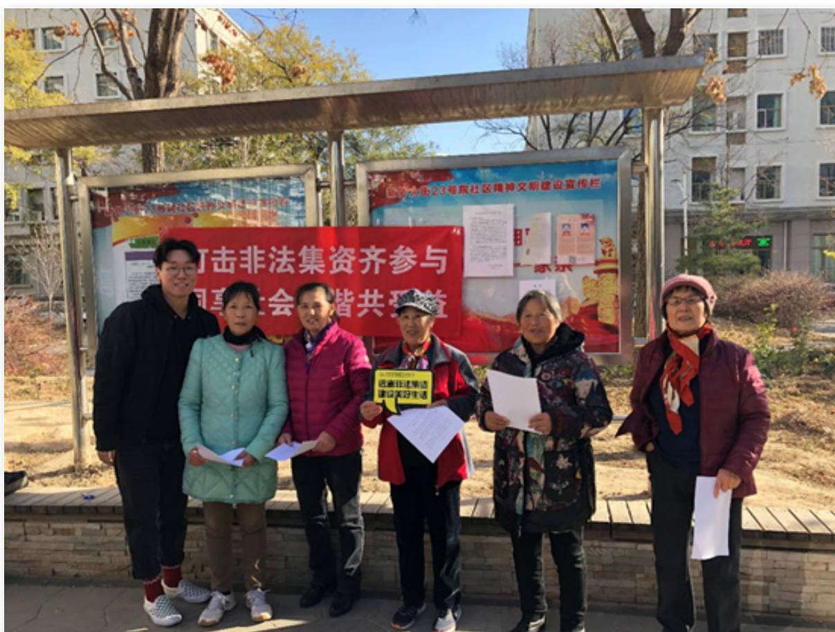
北信瑞丰走进大型社区，现场集中性宣传防范非法集资，进行投资者教育。